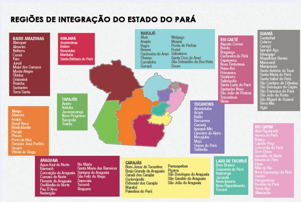
Figura 01 – Ilustração das regiões de integração do Pará

Na figura 01 as 12 regiões estão representadas em: RI Araguaia, RI Baixo Amazonas, RI Carajás, RI Guajará, RI Guamá, RI Lago de Tucuruí, RI Marajó, RI Rio Caeté, RI Rio Capim, RI Tapajós, RI Tocantins e RI Xingu. Cada região é composta por um conjunto de municípios (SECOM, 2023).