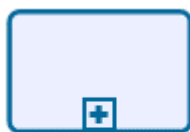
Emitir relatório de impacto